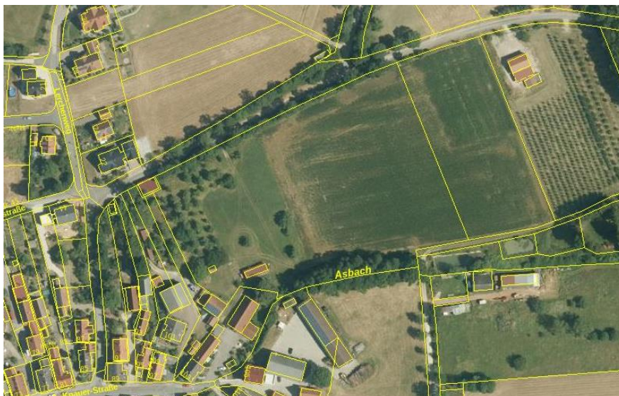
Luftbildkarte des Geltungsbereichs

Die Erschließung ist von der Bergstraße im Westen her möglich. Der von hier aus nach Osten abzweigende landwirtschaftliche Weg muss ausgebaut werden.