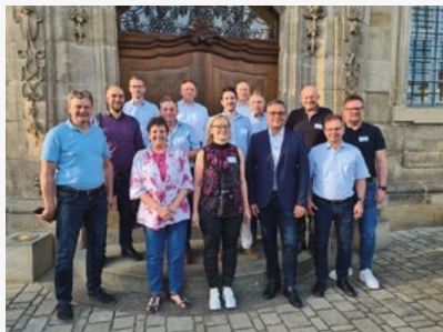
Gruppenfoto vor der SDF Klosterlangheim.

Die Ergebnisse der Klausurtagung werden nun in ein neues Entwicklungskonzept für die interkommunale Zusammenarbeit gegossen und bilden somit auch die Grundlage für eine Förderung durch das Amt für Ländliche Entwicklung Oberfranken für fünf weitere Jahre.