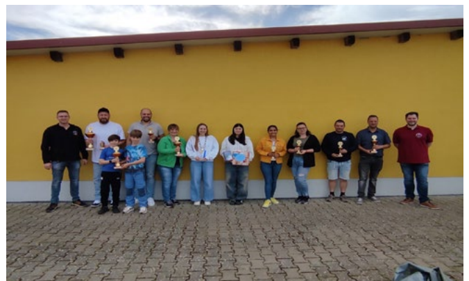
Foto aller Mannschaftssieger sowie Bürgerschützenkönigin und Jugend-Pizza-Königin

Es ergeht ein herzliches „Vergelts Gott“ an alle Teilnehmer und Mitwirkende. Der Schützenverein Eintracht Eggolsheim freut sich schon alle Interessierten im nächsten Jahr wieder begrüßen zu dürfen. Sollte jemand „Blut geleckt“ haben und das Luftgewehr- oder Luftpistolenschießen ausprobieren wollen, gibt es hierzu jeden Mittwoch ab 18:30 Uhr die Möglichkeit auf ein kostenloses Schnuppertraining