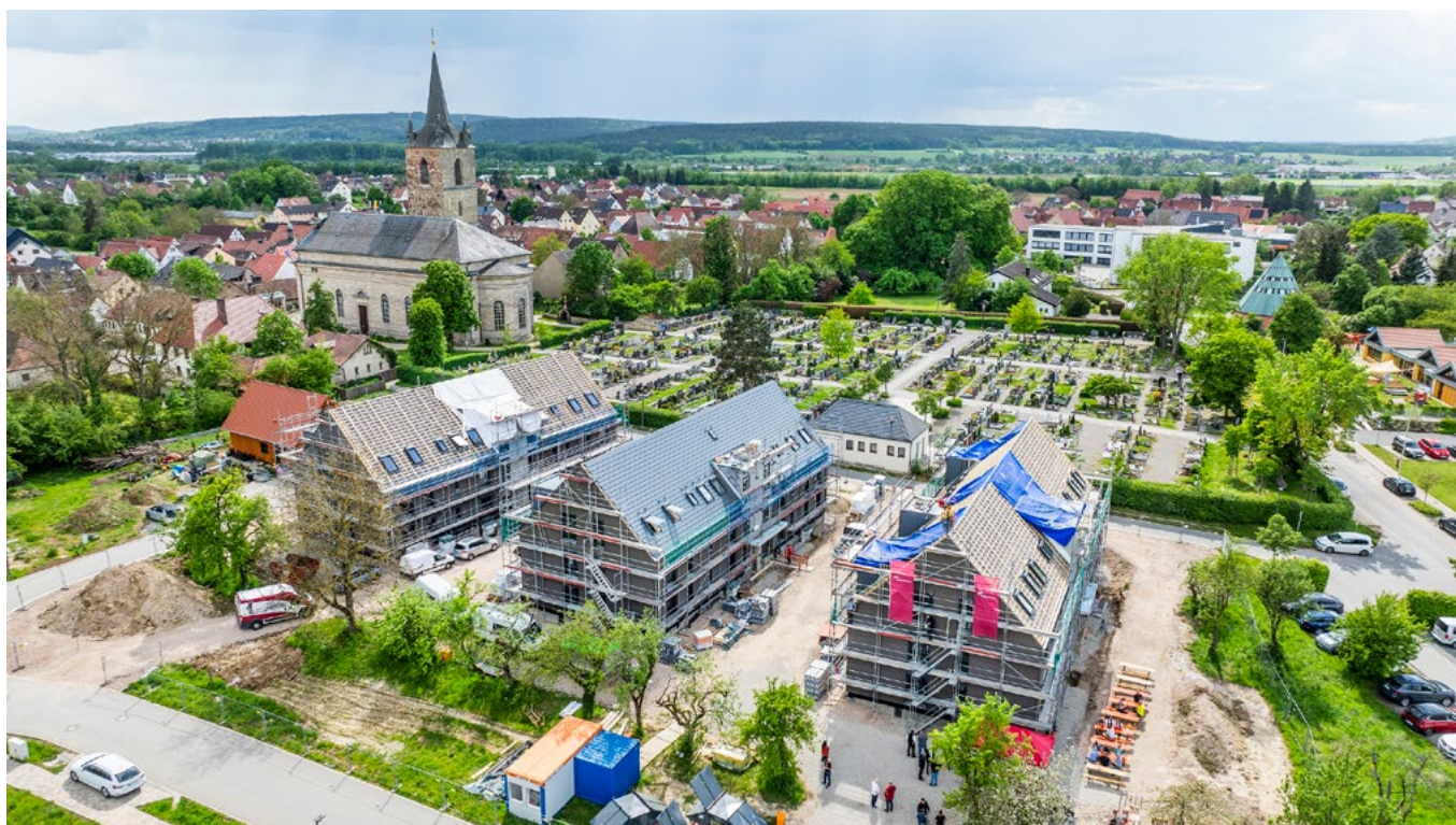
Drohnenaufnahme der 3 Gebäude