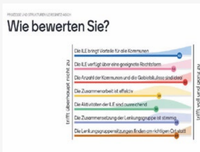
Ergebnisse der Mentimeter-Umfrage