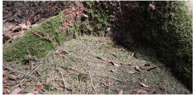
Bei einem Borkenkäferbefall fallen die Nadeln bereits im grünen Zustand ab