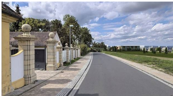
Visualisierung, Stand 07.05.2024, Blick: Jägersburg / Richtung Ortsmitte