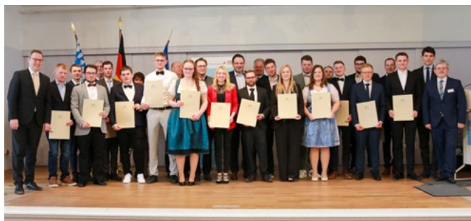
Vier Landwirtschaftsmeisterinnen und 15 Landwirtschaftsmeister aus ganz Oberfranken haben Ihren Meisterbrief erhalten

Inhalte der Meisterprüfung sind unter anderem im Bereich der Produktions- und Verfahrenstechnik der Vergleich und die Bewertung von Produktionsverfahren bei der pflanzlichen oder tierischen Erzeugung mit einem 12-monatigen praktischen Arbeitsprojekt, im Bereich der Unternehmensführung die Analyse und Beurteilung eines fremden Betriebes und im Bereich der Mitarbeiterführung eine praktische Arbeitsunterweisung.