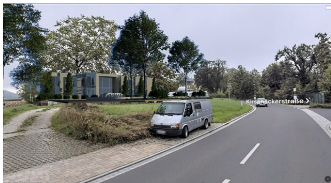
Visualisierung, Stand 07.05.2024, Blick: Kreisstraße / Kirschäckerstraße