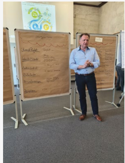
Vorstellung der Ergebnisse der vertieften Projektarbeit.