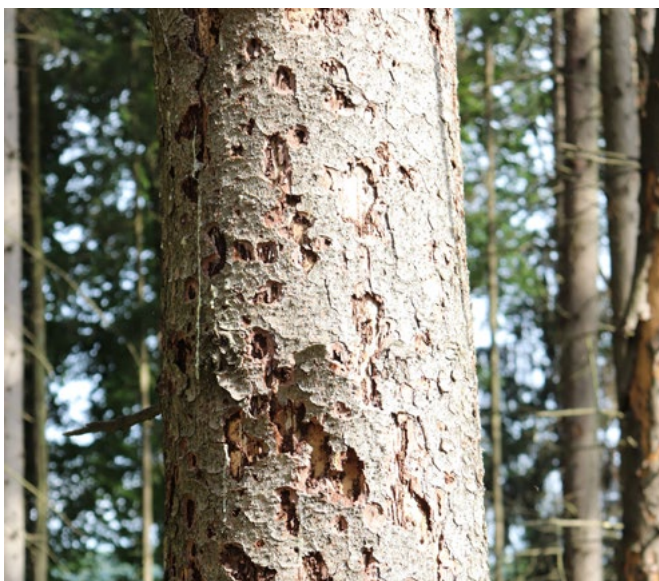
Einbohrlöcher in der Rinde weisen auf einen Befall mit dem Borkenkäfer hin.

Einen Befall melden Sie bitte umgehend ihrem Revierförster oder direkt an das Amt für Ernährung, Landwirtschaft und Forsten in Scheßlitz: schesslitz@aelf-ba.bayern.de oder unter 0951/8687-2000. Für eine Förderung der insektizidfreien Borkenkäferbekämpfung ist ein Kontakt zu Ihrem Revierförster vor dem Beginn der Arbeiten zwingend notwendig. Informationen zu Ihrem Revierförster finden Sie im Internet über den „Försterfinder“ auf dem Waldbesitzer-Portal Bayern: www.waldbesitzer-portal.bayern.de