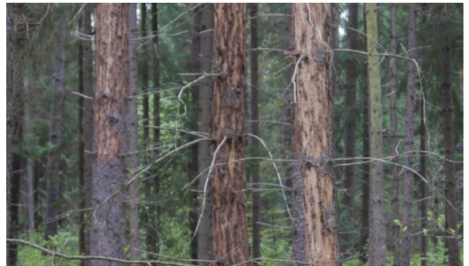
Ein Befall durch den Borkenkäfer lässt sich auch an dem Abfallen der Rinde erkennen.