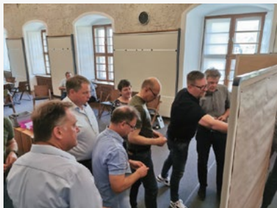
Die Teilnehmer bewerten die einzelnen Projekte.