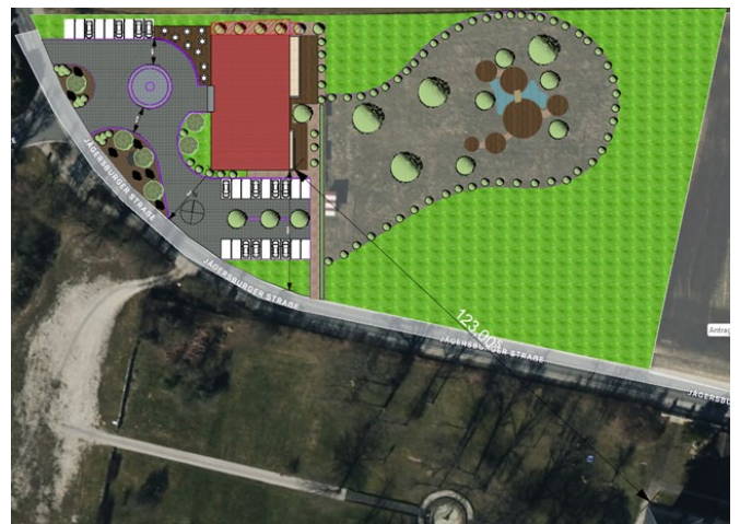
Planstand vom 07.05.2024

Die Vorstellung des aktuellen Planungsstandes übernahm der beauftragte Planer. Er präsentierte den Anwesenden gleich zu Beginn die erste Anpassung. Denn die vor allen von den Betreibern der Jägersburg mit Konfliktpotential belegten betreuten Wohneinheiten im westlichen Bereich des Grundstücks hin zur Jägersburg wurden zurückgenommen. Dadurch vergrößert sich der Abstand zum Schloss von 100 auf 120 Meter und durch den Wegfall der zunächst geplanten dauerbewohnten Gebäude, sollte sich eine mögliche Problemlage bei Events in der Jägersburg entschärfen. Anstelle der Wohngebäude könnte eine 4.500 m 2 große Parkanlage für die Klienten der Tagespflege entstehen. Das Gebäude nimmt nach der aktuellen Planung ca. 3.600 m 2 des Grundstücks in Anspruch. Final präsentierte der Planer entsprechende Visualisierungen des möglichen Gebäudekörpers. Bezüglich Bauform und Gestaltung der Gebäude zeigte er sich offen für konstruktive Anregungen und bei etwaigen Auflagen der Fachbehörden.