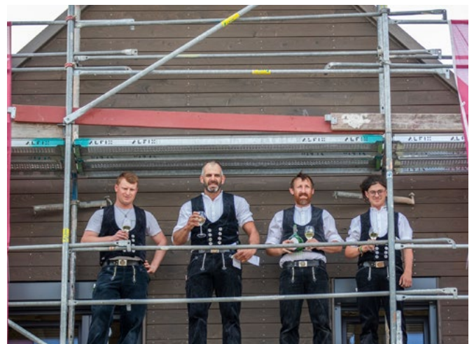
Die Handwerker der Firma Taglieber Holzbau beim Richtspruch