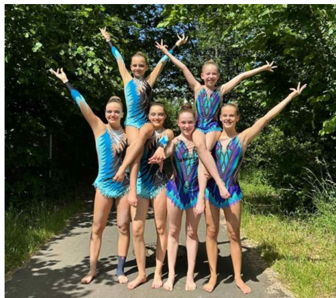
Auftritt Heinrichsfest Bamberg - Sportakrobatik DJK Eggolsheim/Kersbach

Jetzt heißt es motiviert dranbleiben und weiterhin so fleißig zu trainieren, um sich bei den anstehenden Wettkämpfen im Herbst zu steigern und auch den Sprung in die Juniorenklasse im Wettkampffahr 2025 gut meistern zu können.