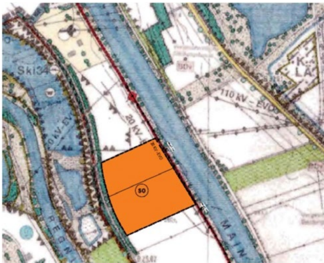
Ausschnitt aus der Flächennutzungsplanänderung

Der Bereich ist im Flächennutzungsplan des Marktes Eggolsheim als Fläche für Landwirtschaft ausgewiesen. Der Flächennutzungsplan soll im Verfahren entsprechend geändert werden.