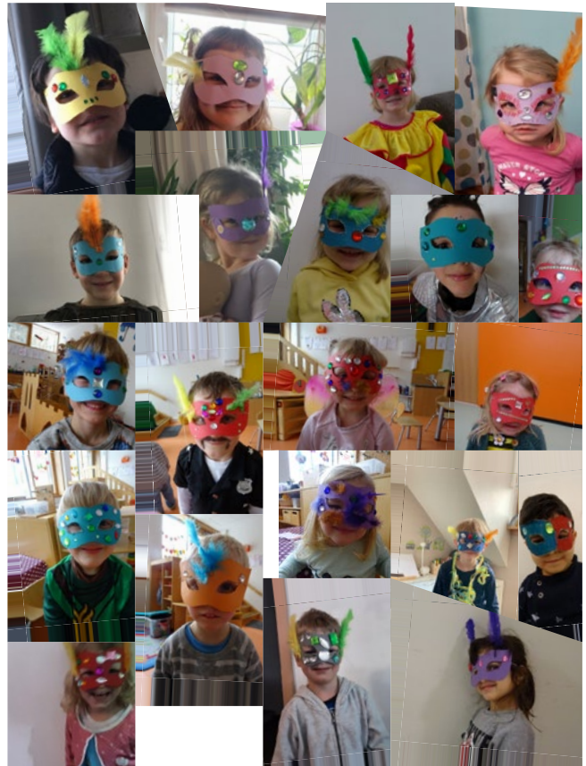
Fasching 2021 zu Hause und in der Kita

Um dann auch allen Kindern an Fasching ein bisschen Freude und Farbe nach Hause zu bringen, überlegten wir uns eine gemeinschaftliche Aktion. Dafür sollten alle Sonnenkinder eine venezianische Maske basteln: die Kinder zu Hause erhielten dafür Post von uns mit allen nötigen Materialien, wie Federn und Glitzersteine. Mit den Kindern im Kindergarten wurden ebenfalls die bunten Masken ausgeschnitten und verziert. Als die tollen Werke fertig waren, haben wir von allen maskierten Kindern Fotos gemacht, die wir anschließend zu einer Collage gestalteten. Dazu schickten uns auch die Eltern der Kinder von zu Hause Fotos. So konnten wir alle getrennt und doch gemeinsam ein bisschen Faschings - Feeling erleben.