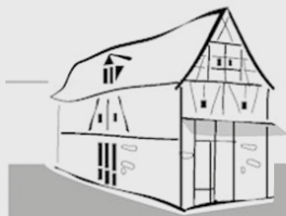
MARKTBÜCHEREI ST. MARTIN EGGOLSHEIM - AM GEMEINDEZENTRUM