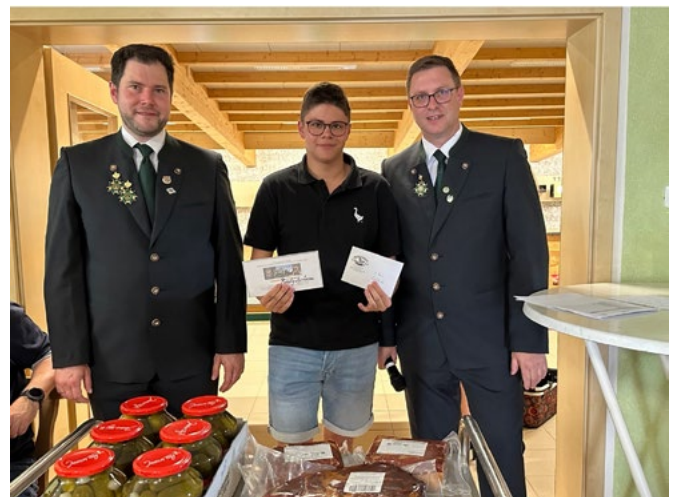
1. Platz Meistbeteiligung: EggsHAMMER Jungspunde

Als Finale absolvierte der neue Bürgerschützenkönig den traditionellen Königstanz. Es ergeht ein herzliches „Vergelts Gott“ an alle Teilnehmer und Mitwirkende. Der Schützenverein Eintracht Eggolsheim freut sich schon alle Interessierten im nächsten Jahr wieder begrüßen zu dürfen. Sollte jemand „Blut geleckt“ haben und das Luftgewehr- oder Luftpistolenschießen ausprobieren wollen, gibt es hierzu jeden Mittwoch ab 18:30 Uhr die Möglichkeit auf ein kostenloses Schnuppertaining.