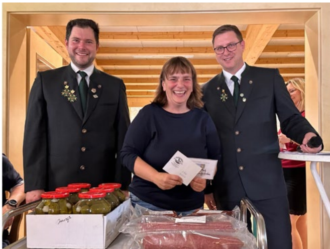
3. Platz Meistbeteiligung: St. Martin Schützen