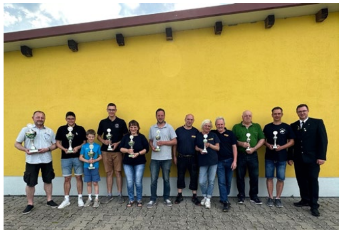
Alle Pokalgewinner der Mannschaftswertung