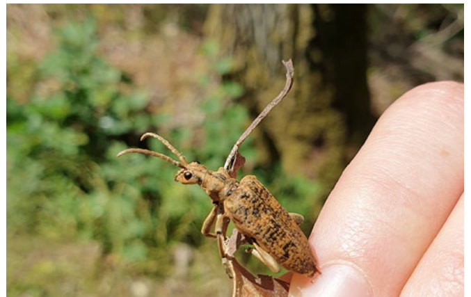
Die Larven des als gefährdet eingestuften Großen Laubholz-Zangenbocks sind vor allem auf abgestorbene Eichen angewiesen - die Hauptbaumart der fränkischen Mittelwälder.