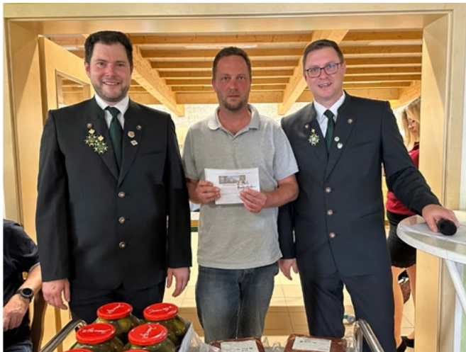
2. Platz Meistbeteiligung: FFW Unterstürmig