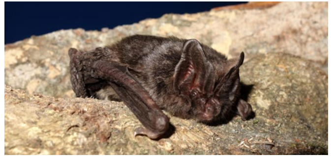
Die Mopsfledermaus hat hohe Ansprüche an ihren Lebensraum und konnte mithilfe eines Batcorders, der ihre Rufe aufzeichnete, im Mittelwald von Kirchehrenbach nachgewiesen werden (Foto: Andreas Zahn, Waldkraiburg).

Die Arterfassung wurde mit Unterstützung der Kreisgruppen Forchheim des LBV und des Bund Naturschutz durch ein vielfältiges Programm für die Öffentlichkeit umrahmt. Bereits am Samstagabend konnten Exkursionsteilnehmer dank technischer Hilfsmittel die Rufe von Fledermäusen identifizieren und beim Lichtfang Nachtfalter beobachten. Nach diversen Kurzvorträgen folgten am Sonntag weitere geführte Exkursionen, die sowohl Laien als auch fortgeschrittenen Artenkennern die Artenvielfalt in Mittelwäldern näherbrachten.