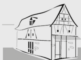
MARKTBÜCHEREI ST. MARTIN EGGOLSHEIM - AM GEMEINDEZENTRUM