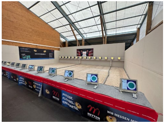
Einzug ins Schützenfestzelt am Fuße der Bavaria