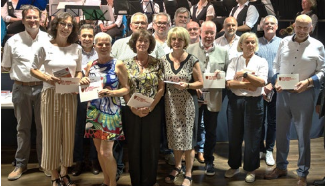
Ehrung für 50 Jahre Mitgliedschaft.