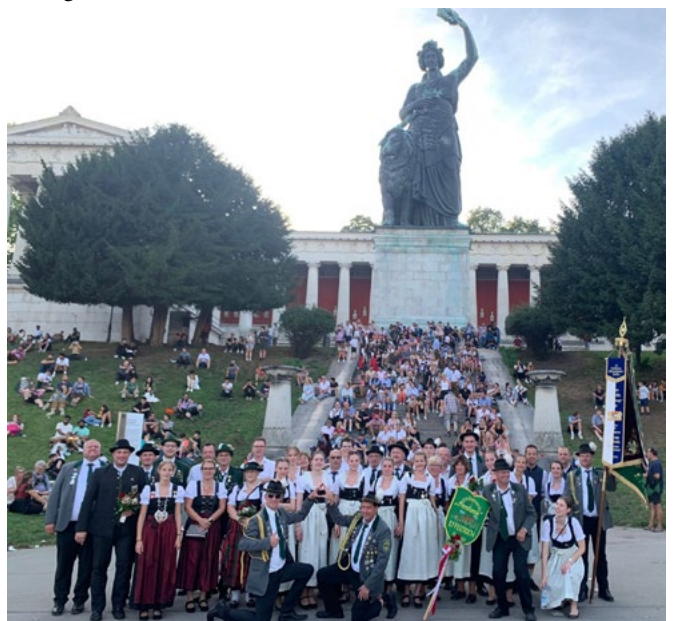
Die langersehnte Erfrischung nach einem anstrengenden Umzug Ein Ausschnitt aus der top-modernen Elektronischen Schießanlage Das Abschlussfoto der Reisegruppe des Bezirks Oberfranken am Fuße der Bavaria