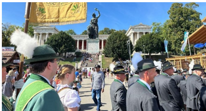
Auf der Maximilianstraße