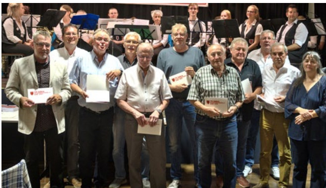
Ehrung für 60 Jahre Mitgliedschaft.