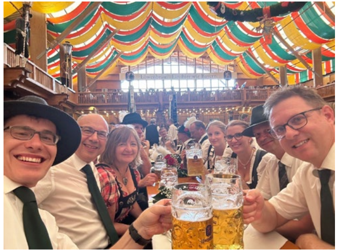
Ankunft auf der Theresienwiese