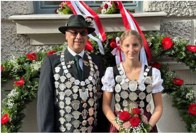
Fortsetzung nächste Seite