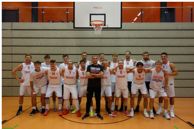
Die neu formierte Mannschaft der DJK Eggolsheim