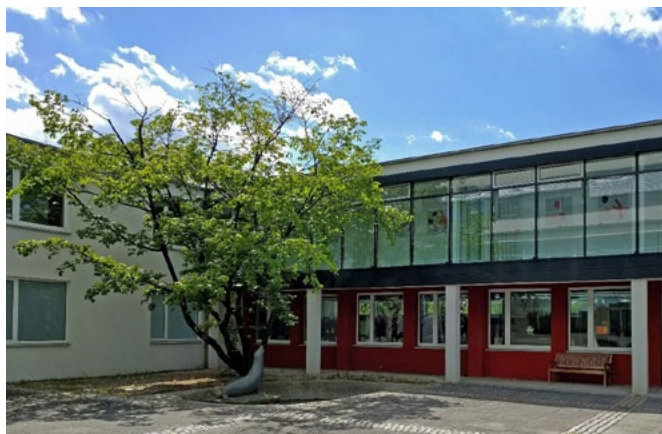
Das Gebäude der Berufsfachschulen des DEB in Bamberg.

Am 26. Oktober 2023 öffnen die staatlich anerkannten Berufsfachschulen des Deutschen Erwachsenen-Bildungswerks (DEB) in Bamberg ihre Türen für Interessierte an einer Ausbildung im Gesundheits- und Sozialbereich. Besucher erhalten Einblicke in die Ausbildungen zum Ergotherapeuten (m/w/d), zum Physiotherapeuten (m/w/d) sowie zum Pharmazeutisch-technischen Assistenten (PTA) (m/w/d).