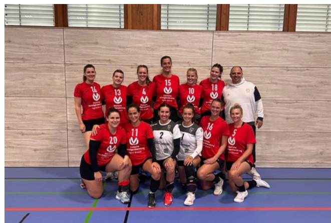
Mannschaftsbild des neuen Teams

Am 28.10.2023 um 14:00 Uhr findet in der Eggerbach-Halle der erste Landesligaspieltag der Volleyballerinnen der DJK Eggolsheim statt. Nach dem grandiosen Aufstieg in die Landesliga wird zum ersten mal Landesligavolleyball in Eggolsheim zu sehen sein. Bereits am 30.09. hatte die DJK ihr erstes Spiel in Vohenstrauß. Dort hatte man gut gespielt aber gegen den letztjährigen Landesligadritten mit 3:1 verloren. Vor den ersten Heimspieltag muss man aber erst noch in Weiden antreten (Ergebnis lag bei Redaktionsschluss) noch nicht vor. Eggolsheims Volleyballdamen hoffen natürlich auf die große Unterstützung von vielen Fans in der heimischen Arena. Für Verpflegung ist wie immer bestens gesorgt.