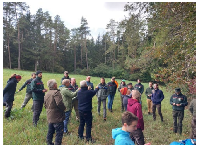
Vorstellung der Roßdorfer Mehlbeere