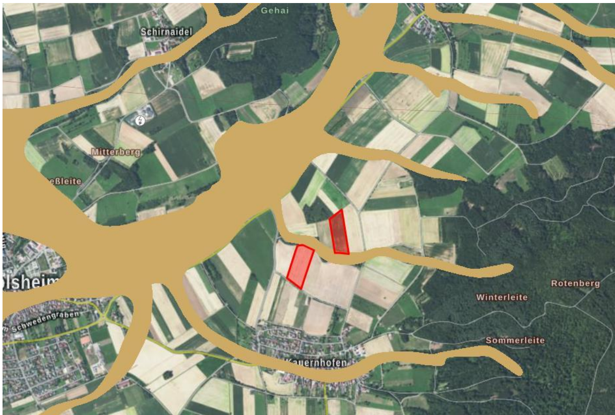
ROT: Plangebiet, BRAUN: Wassersensibler Bereich (BayernAtlas 2024, nicht maßstäblich)

Das Planareal liegt im Grundwasserkörper „Feuerletten/Albvorland - Eggolsheim“. Laut Kartendienst der Wasserrahmenrichtlinie befindet sich dieser in einem mengenmäßig und chemisch guten Zustand.