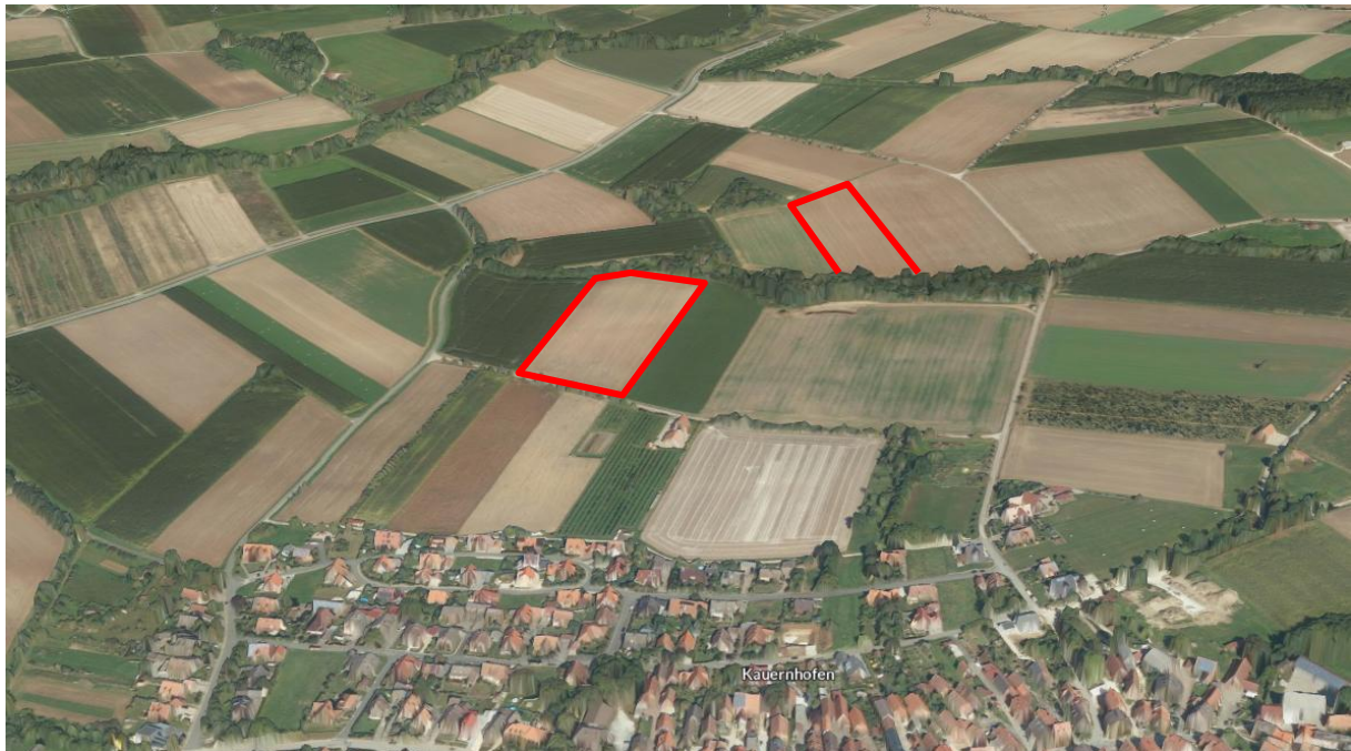
ROT: Plangebiet (EnergieAtlas 2024, nicht maßstäblich)

Eine anthropogene Vorprägung ist durch die intensive ackerbauliche Nutzung der Areale sowie der Nachbarflächen bereits gegeben. Die ca. 280 m westlich entfernte Kreisstraße FO 5 stellt ebenfalls eine anthropogene Vorbelastung der Gegend dar.