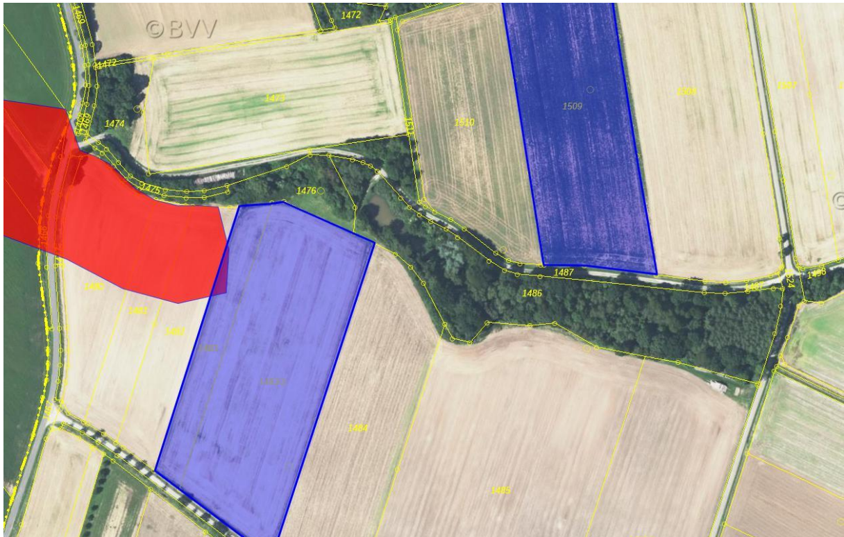
BLAU: Plangebiet, ROT: gestrichenes Bodendenkmal (BayernAtlas 2024, nicht maßstäblich)

Baudenkmäler befindet sich ebenso nicht auf dem Vorhabenareal.