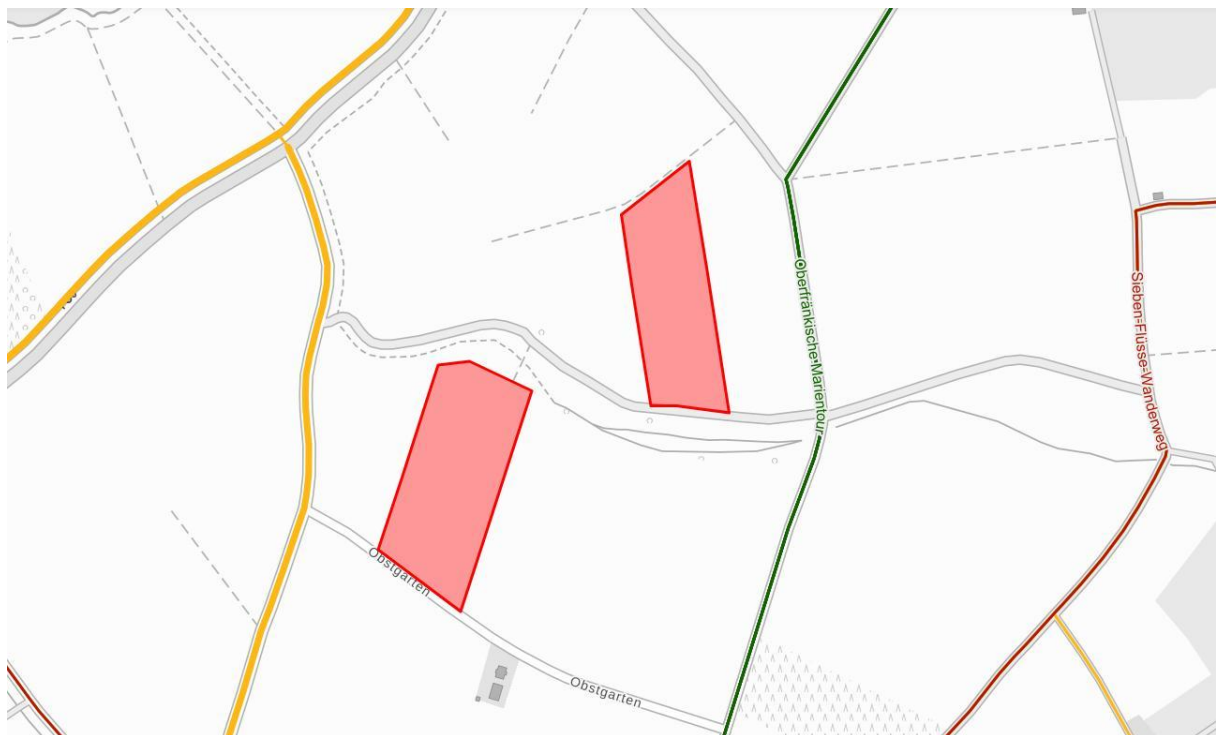
Übersichtskarte Freizeitwege ROT: Plangebiet (BayernAtlas 2024, nicht maßstäblich)

Der nächstgelegene Freizeitweg zu der „Teilfläche Süd“ ist der örtliche Wanderweg „Gemeinde Eggolsheim - Lauferlebnis Fränkische Schweiz E1“ in etwa 80 m westlicher Entfernung. Am nächsten zu „Teilfläche Nord“ liegt ein Fernradweg der Teil der „Fürstbischöfliche Tour“, der „Brauereien- und Bierkellertour“, der „Radrunde Oberfranken“ und der „Oberfränkische Marientour“ ist. Der genannte Freizeitweg ist ebenfalls als Radweg sowie als örtlicher Wanderweg gekennzeichnet und verläuft in etwa 90 m im Osten der Teilfläche.