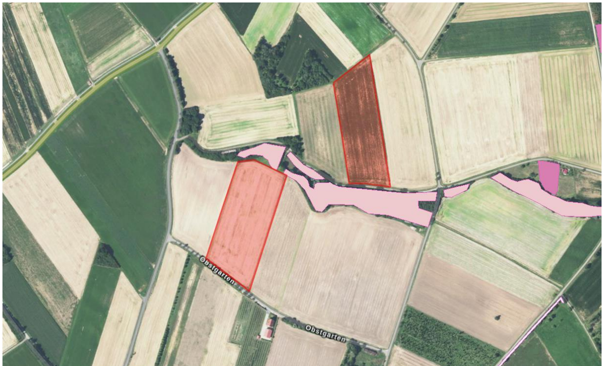
ROT: Plangebiet, ROSA: Biotopkartierung (BayernAtlas 2024, nicht maßstäblich)

Die Planflächen liegen innerhalb des Naturparks „Fränkische Schweiz – Veldensteiner Forst“ (ID: NP-00009). In gut 500 m östlicher Entfernung befindet sich das FFH-Gebiet „Albtrauf von der Friesener Warte zur Langen Meile“ (ID DE Code Teilfläche: DE6132371.04). Etwas näher in etwa 400 liegt das Landschaftsschutzgebiet „LSG „Fränkische Schweiz – Veldensteiner Forst“ (ID: LSG-00556.01). SPA-Gebiete befinden sich nicht im näheren Umkreis der Fläche.