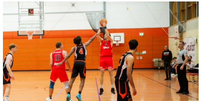
Neuzugang Engel fügt sich mit Treffsicherheit gut ins DJK Spiel ein