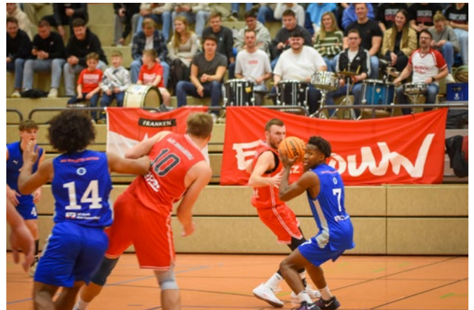
Um jeden Ball wurde in diesem dramatischen Spiel gekämpft