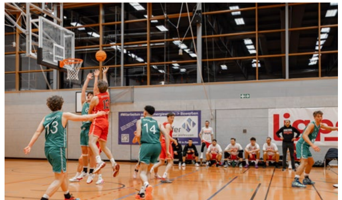
Auch Amon wirkt wieder mit und schließt erfolgreich ab